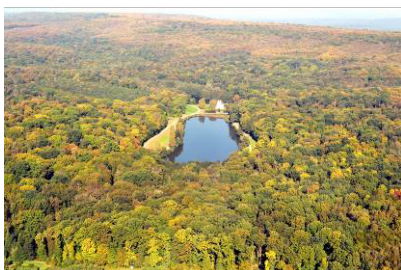
La forêt de Montmorency

Les sangliers, une population à réguler.