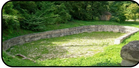
Le vieux gué, abreuvoir - Louvres

Départ : Vitelle Equestre Chemin Vicinal n° 2 – Butte de Vitelle 95380 LOUVRES