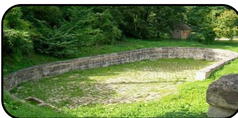
Le vieux gué, abreuvoir – Louvres

Départ : Vitelle Equestre Chemin Vicinal n° 2 – Butte de Vitelle 95380 LOUVRES