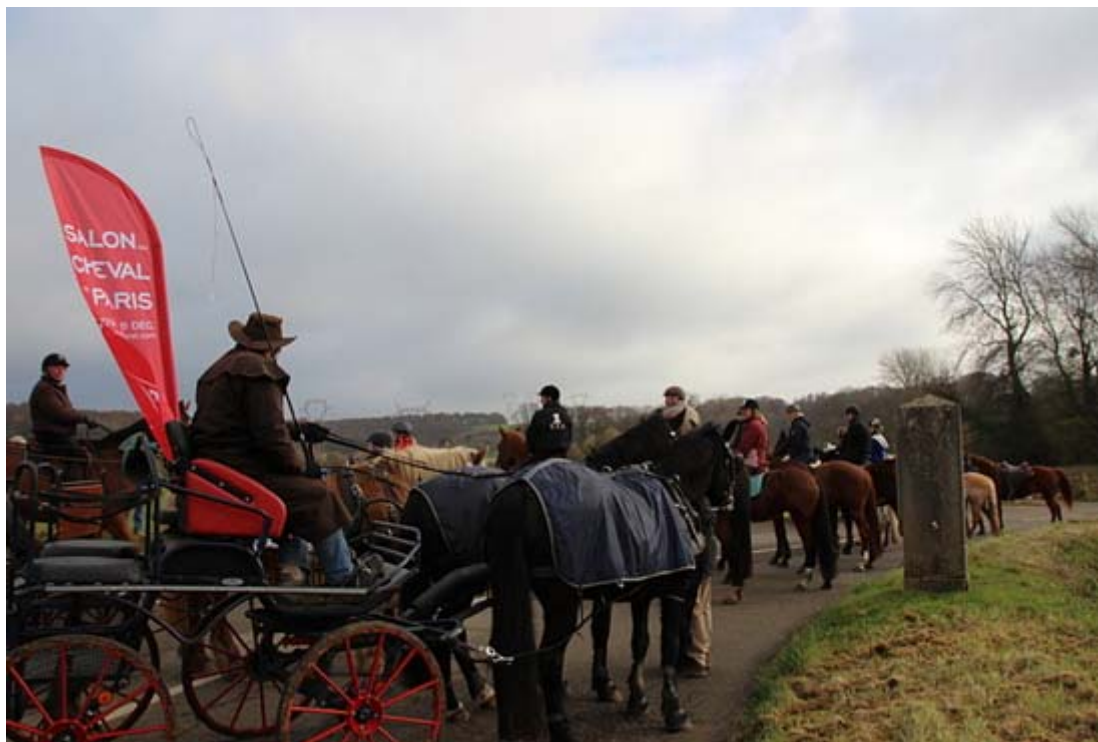
Attelages et cavaliers

FÉDÉRATION FRANÇAISE D'ÉQUITATION COMITÉ DÉPARTEMENTAL D'ÉQUITATION