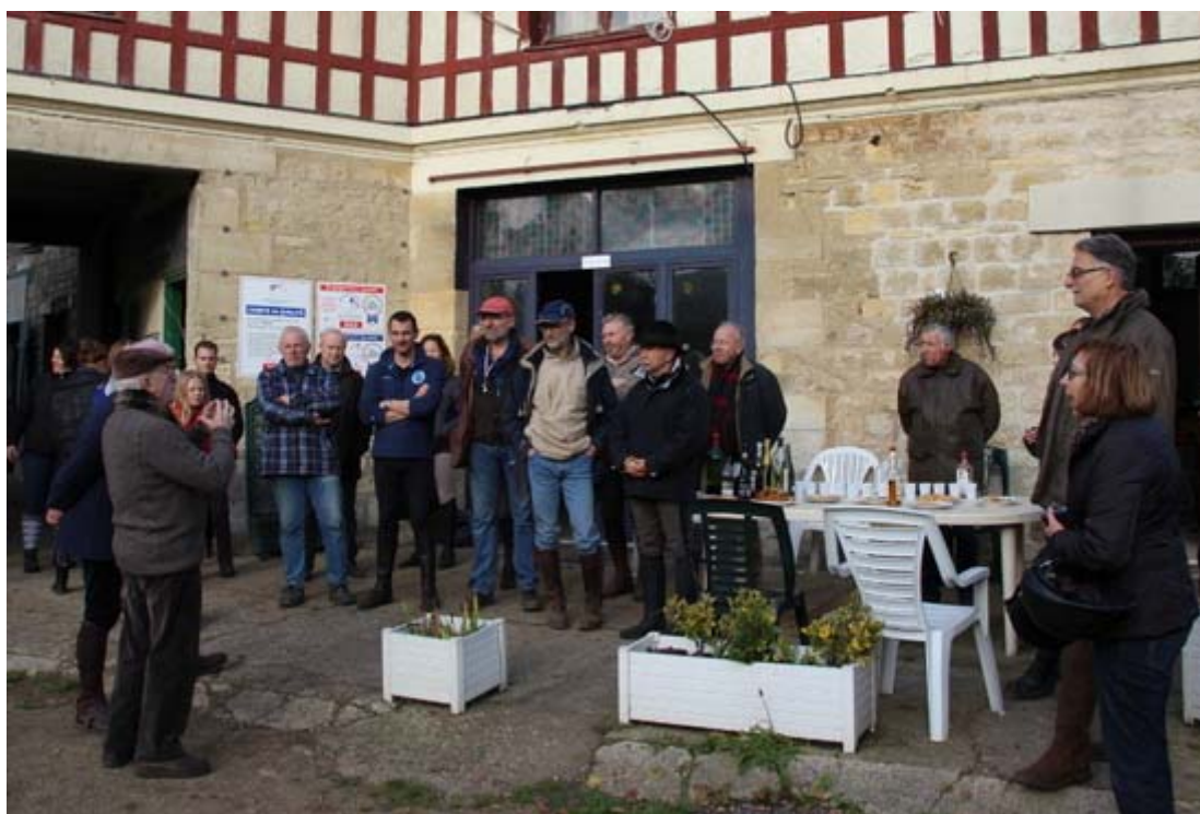
Pot de clôture au club hippique Neslois

CDEVO Maisons des Comités Sportifs Jean Bouvelle 106 rue des Bussys 95600 EAUBONNE ☎ 01.39.59.74.02 📠 01.39.59.74.02