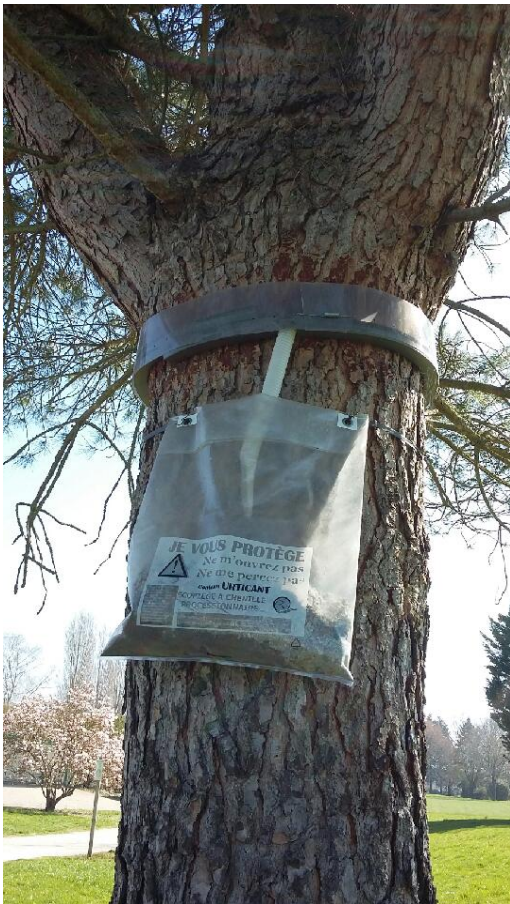
Ecopiège à chenilles processionnaires sur le tronc d'un pin