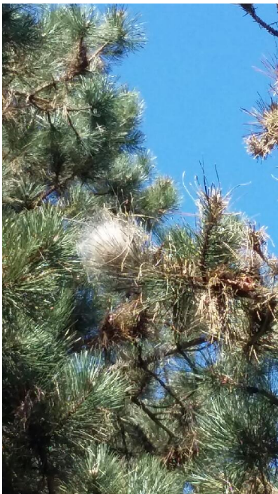
Nid de chenilles processionnaires dans un pin

La période d' éclosion des chenilles débute 30 à 45 jours après l'émergence des adultes ; elle s'étale de fin juillet à fin septembre . Dès l'éclosion, les chenilles entament la construction d'un nid de soie très fin autour de l'emplacement de ponte, appelé « pré-nid ».