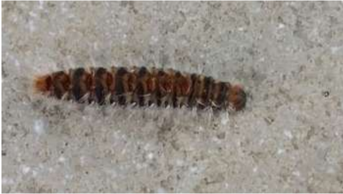
Chenille processionnaire

La chenille processionnaire du pin est la larve d'un papillon de nuit nommé Thaumetopoea pityocampa , dont le nom fait référence au mode de déplacement des chenilles en file indienne . Il fait partie des papillons venimeux présents en France.