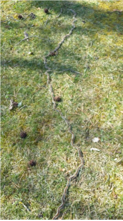
File indienne de chenilles au sol, caractéristique de la procession de nymphose

La procession de nymphose est la dernière étape de la phase aérienne. Elle correspond au moment où les chenilles, à la recherche d'un terrain meuble et ensoleillé où s'enfouir pour terminer leur développement, quittent leur arbre en direction du sol en se suivant en file indienne (telle une « procession »). Cette phase de déplacement, de mi-février à mi-mai , est la période où les chevaux sont les plus exposés : les risques de contact avec les chenilles sont élevés ! Lorsqu'elles se sentent menacées (piétinement, proximité d'un prédateur...), les chenilles libèrent en effet leurs poils urticants allergènes dans l'environnement.