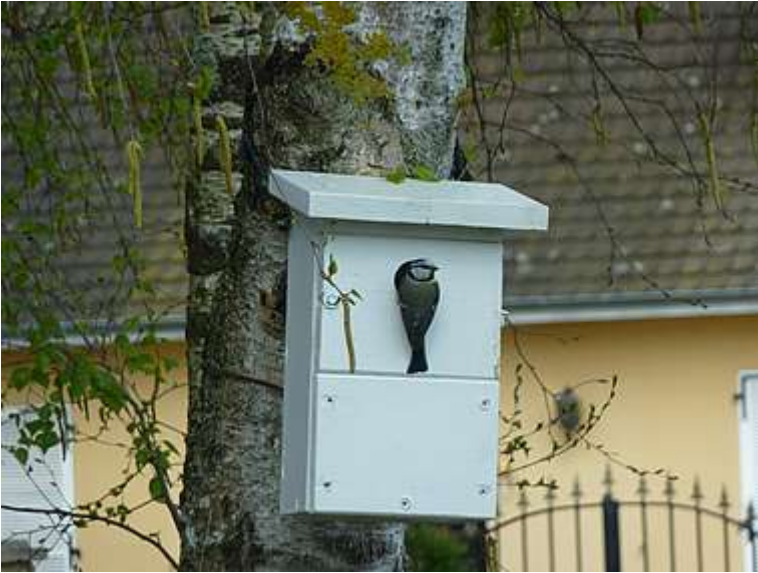
La mésange, prédateur naturel des chenilles processionnaires du pin

Il existe différentes mesures de prévention/moyens de lutte pour limiter les risques liés à la processionnaire du pin.