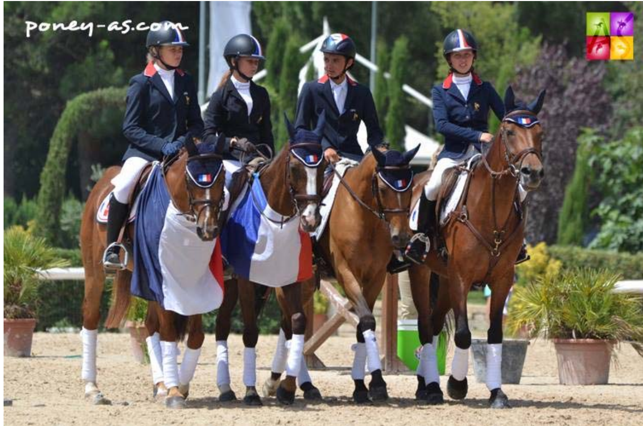
Equipe de France

FÉDÉRATION FRANÇAISE D'ÉQUITATION COMITÉ DÉPARTEMENTAL D'ÉQUITATION