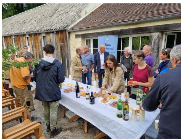
De l'effort au réconfort... Le plaisir de la randonnée